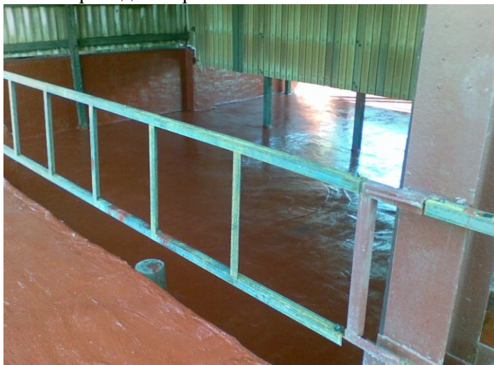
Общий вид конструкции