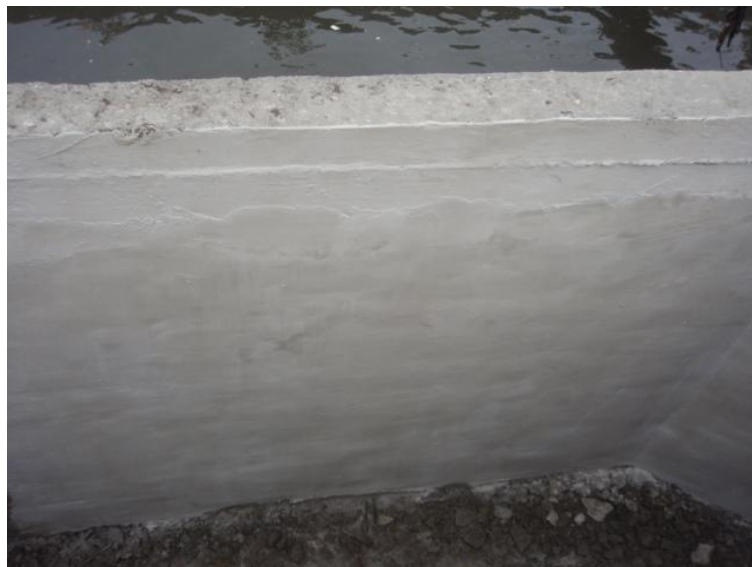
После проведения работ