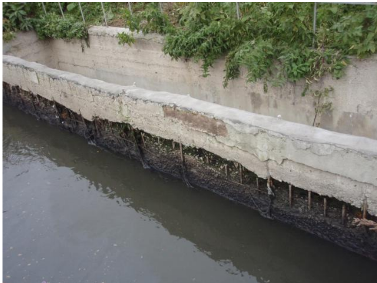
До проведения работ