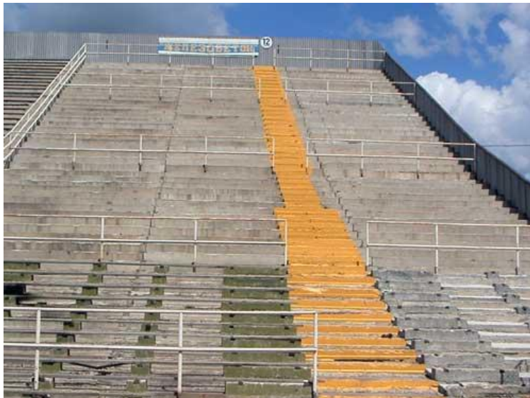
До проведения работ