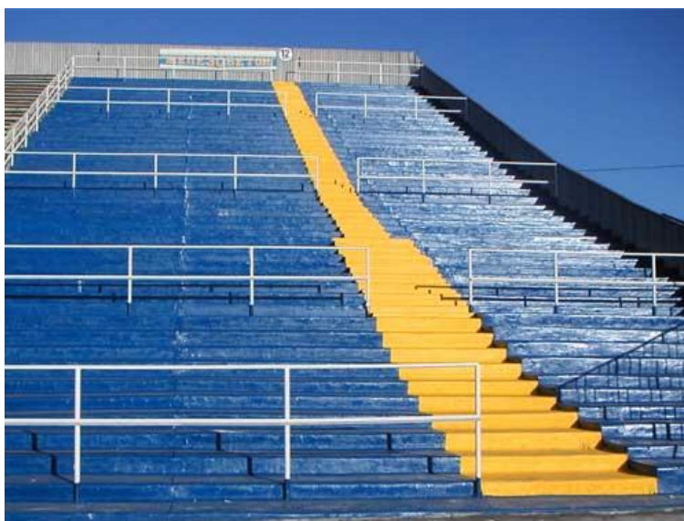
После проведения работ