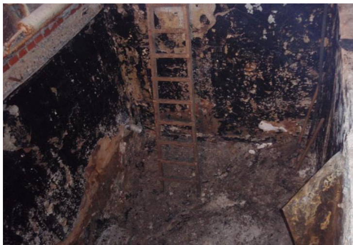
До проведения работ