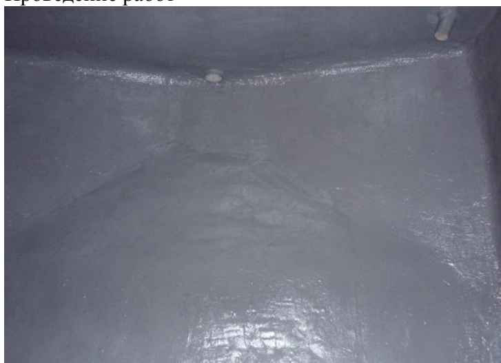
После проведения работ